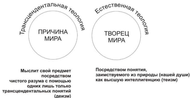
Рис.1. Естественная и трансцендентальная теологии

Мы видим, что по отдельности каждая из них не обладает достаточной полнотой для понимания «высшей интеллигенции» 1 : Бог непостижим ни через понятие, ни через непосредственный опыт, если не выстраивать отношения между ними. Для этой цели, человек наделён «мыслящим Я» или душой (по Канту) 2 . Далее, на основании, построенной модели познания он доказывает невозможность обоснования существования Бога, исходя исключительно из непосредственного чувственного Его восприятия, в силу его невозможности, и, тем самым, развенчивает любые основания «физикотеологии» (рис. 2).