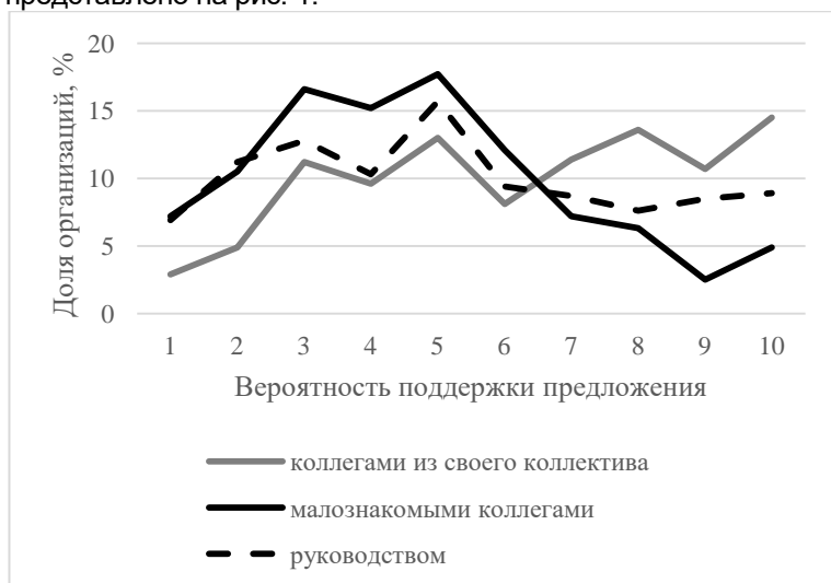
Рис. 1. Распределение организаций по оценочной вероятности поддержки инициативы сотрудника

Для оценки внутреннего инновационного климата в организации респондентам было предложено оценить вероятность, с которой инициатива (предложение) сотрудника будет положительно воспринято коллегами и руководством. Для оценки вероятности использовалась 10-балльная шкала, являющаяся приближением интуитивно понятной шкалы оценки вероятности от 0 до 100%. Распределение оценок представлено на рис. 1.