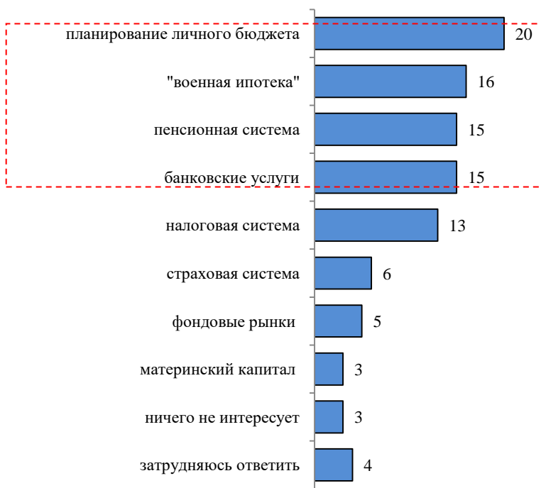
Рис. 1. Вопросы финансовой грамотности, вызвавшие наибольший интерес у военнослужащих (в %)

Следует отметить, что абсолютное большинство (90%) военнослужащих сообщили о практике учета своих личных денежных средств, а 3% военнослужащих полагают это нецелесообразным.