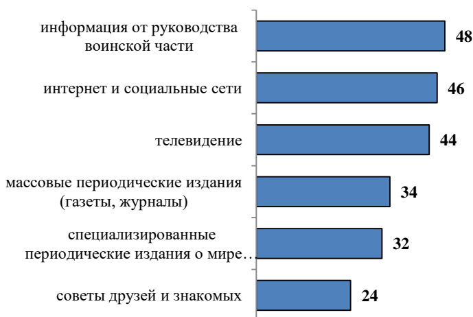
Рис. 2. Источники информации, наиболее популярные среди военнослужащих для повышения уровня финансовой грамотности (в %)

Финансовая стабильность в государстве, достигнутая в 2016-2017 гг., является определяющим моментом в отношении военнослужащих к вопросам повышения своей финансовой грамотности. Так, абсолютное большинство военнослужащих (74%) за последние два года не сталкивались с проблемными ситуациями в области финансов, еще 14% затруднились ответить на этот вопрос. Чаще всего проблемы в финансовой сфере возникали у военнослужащих в случае отзыва лицензии у банка, в котором был открыт вклад (8%).